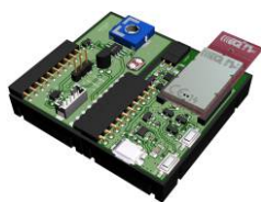
Sensor kit temperature, light intensity and voltage