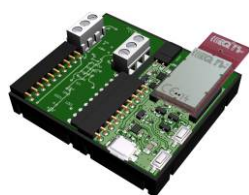
Relay kit switch connected device ON/OFF